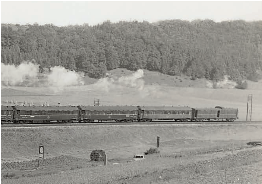
18 470 mit dem L 63 (O.E.) auf der Schwäbischen Alb mit vier Schlafwagen Typ S, zwei Gepäck- und einem Speisewagen (1928).

Zum Lokomotiveinsatz in aller Kürze nur so viel: Als S 14 bezeichnete Pazifiks der AL (spätere 1.231 B der SNCF) brachten den Orient-Express bis Kehl, wo er von der Deutschen Reichsbahn übernommen wurde. Zwischen Kehl und Stuttgart beförderten Karlsruher P 10 (Baureihe 39), zwischen Stuttgart und München bayerische S 3/6 (Baureihe 18 4-5 ) des Bw München Hbf, außerdem bis 1926 noch württembergische C (Baureihe 18 1 ) des Bw Stuttgart-Rosenstein den Luxuszug. Mit Münchner S 3/6 fuhr er weiter bis Salzburg; aus dem Jahr 1921 ist auch der Einsatz der damals nagelneuen bayerischen P 3/5 H überliefert. Nach der Elektrifizierung von München bis Rosenheim 1927 und bis Salzburg 1928 oblag die Traktion hier vor allem E 16. Nachdem der Fahrdraht 1931 von München her Augsburg erreicht hatte, musste im